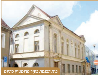
בית הכנסת בעיר פרוסטיץ כהיום